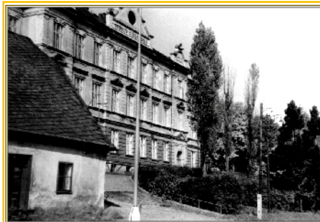
Budova školy v září 1970 a po zahájení generální opravy v roce 1975