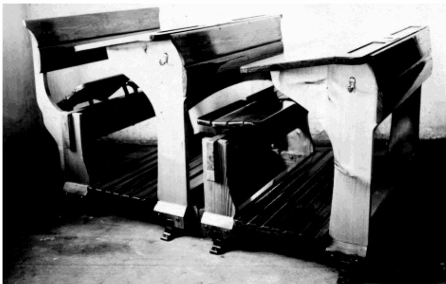
Dobová školní lavice z dvacátých let tohoto století