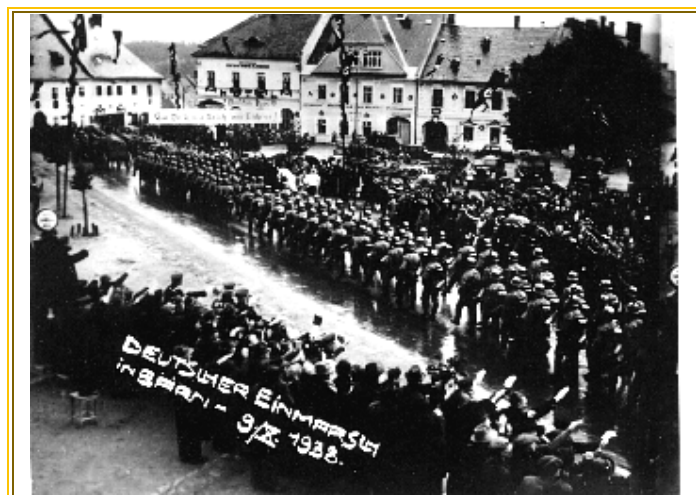
Dne 9. října 1938 vstoupily německé vojenské jednotky do města