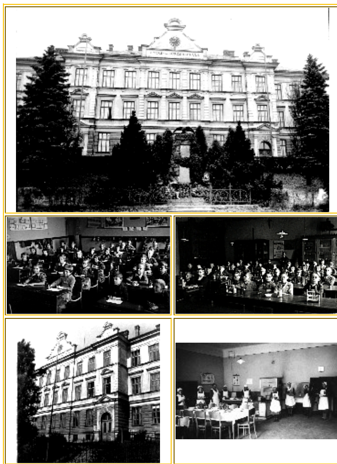
V listopadu 1937 se na žádost Ministerstva školství prováděla fotodokumentace na všech školách v republice