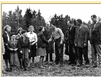
Zástupci JZD přebírají Sad pionýrů v roce 1957